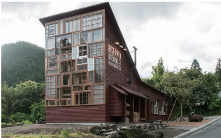
「丘ばち」が採取した蜂蜜、季節によって色や香りが異なるノビル屋上で養蜂する「丘ばちプロジェクト」/丘ばちビールを醸造する「ライズ&ウィンブルーイングカンパニー」

自由が丘商店街振興組合は今年5月、自由が丘産蜂蜜を使ったクラフトビール「丘ばちビール」をテスト販売する。緑多い街並みを目指す同組合の緑化活動「自由が丘森林化計画」のメイン事業として2009年に始めた都市養蜂「丘ばちプロジェクト」が、今年活動10周年を迎えることから企画した。街で養蜂する「丘ばち」から採取した蜂蜜は、これまで