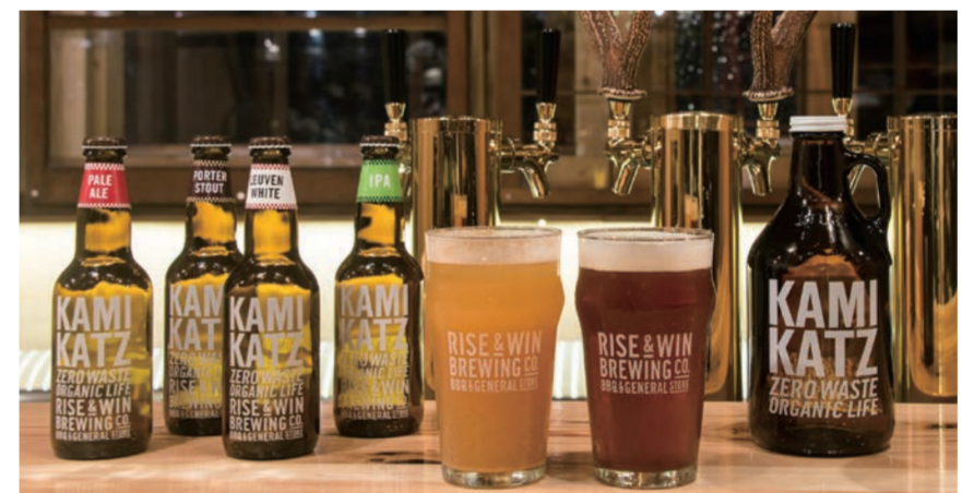
同ブルーリーのクラフトビール「KAMIKATZ(カミカツ)」

自由が丘商店街振興組合は今年5月、自由が丘産蜂蜜を使ったクラフトビール「丘ばちビール」をテスト販売する。緑多い街並みを目指す同組合の緑化活動「自由が丘森林化計画」のメイン事業として2009年に始めた都市養蜂「丘ばちプロジェクト」が、今年活動10周年を迎えることから企画した。街で養蜂する「丘ばち」から採取した蜂蜜は、これまで