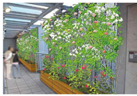
自由が丘スイーツフォレスト・テラス部分にバラ園を新設

「バラの蜂蜜を自分たちの手で復活させたい」と街にバラを植える「バラ園」造りを思い立った同組合は、東急電鉄が沿線の緑の街づくり活動を支援する「みどりリンク」