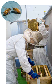
丘はちプロジェクトは今年、活動開始から初の「ミツパチの越冬」に成功。今年度はセイヨウミツバチ約4万5000匹でスタートし、現在順調に増やしている。

に応募、見事今年度の支援対象グループに選ばれた。4月から街の各所に苗木を植えた「プランター」を設置し、6月には南口・自由が丘スイーツフォレスト3階テラス部分にバラ園が完成する予定。